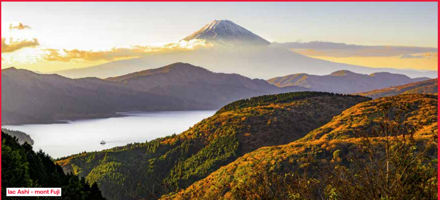
lac Ashi - mont Fuji