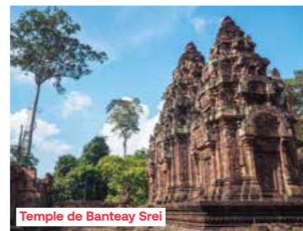
Temple de Banteay Srei

Départ pour une journée complète consacrée à Angkor. Le matin, visite du temple Banteay Srei. Surnommé « la citadelle des femmes », ce temple plat cerné de douves, est une merveille, édifiée au Xe siècle, dont l'aspect a conservé une remarquable fraîcheur. Prenant