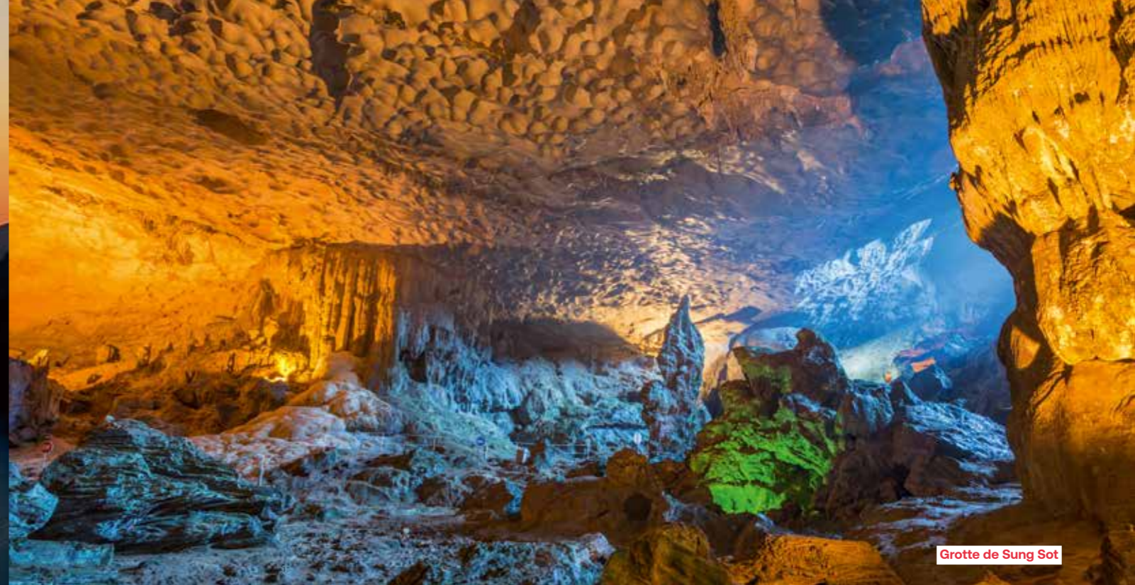
Grotte de Sung Sot