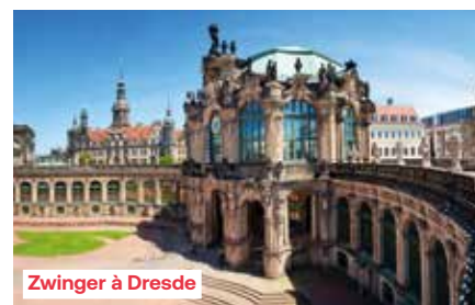
Zwinger à Dresde

Le matin, le bateau poursuit sa route à travers la féérique Suisse saxonne, où l'on peut voir le massif gréseux de l'Elbe. Cette chaîne s'étend entre le Land de Saxe et le Nord de la Bohême tchèque. Ses spectaculaires formations rocheuses ont fait sa renommée, de même que la diversité de sa faune et de sa flore. Vous y découvrirez des ruines d'édifices érigés pour